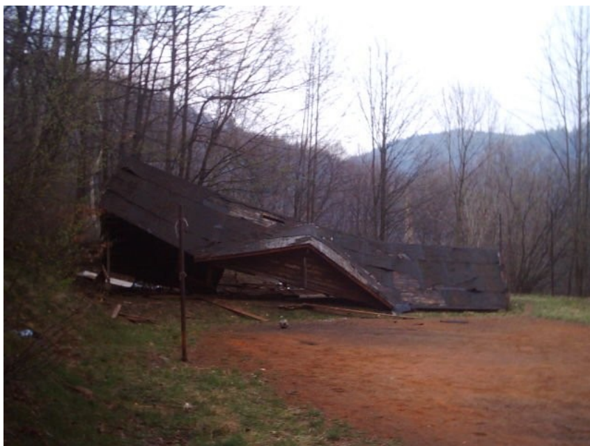
Původní přístřešek z 30.let

Pro ilustraci současného zanedbaného stavu přikládáme fotografie z brigád v minulých letech: